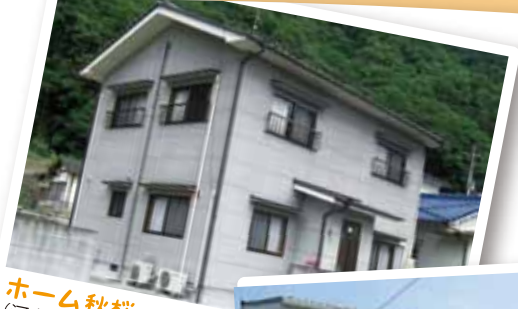
ホーム秋桜 (河南町)