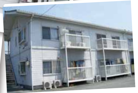
ホームすまいる (鵜飼町)