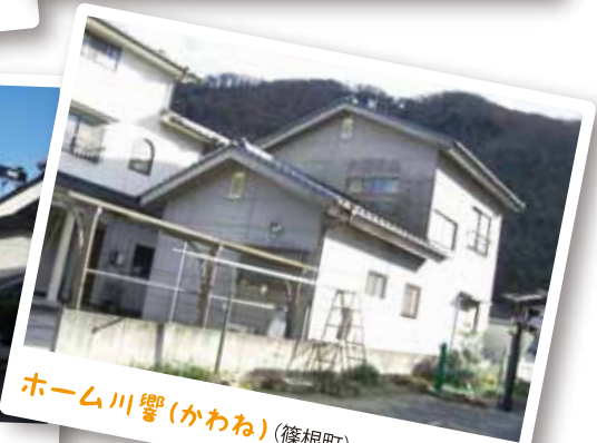
ホーム川響(かわね) (篠根町)