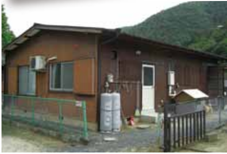
ホームらん (三郎丸町)