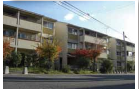
ホームひかり (高木町)