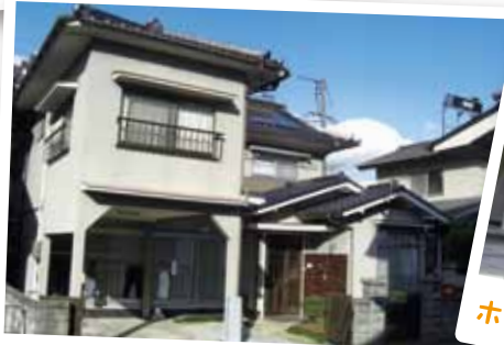
ホームたんぼぼ (篠根町)