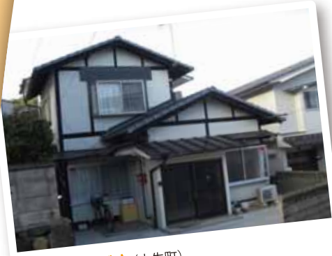
ホームつばさ (土生町)