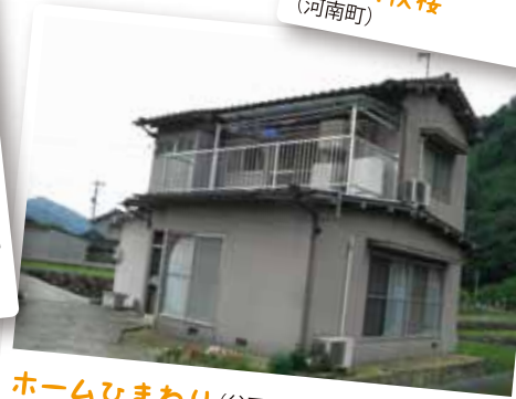
ホームひまわり (父石町)