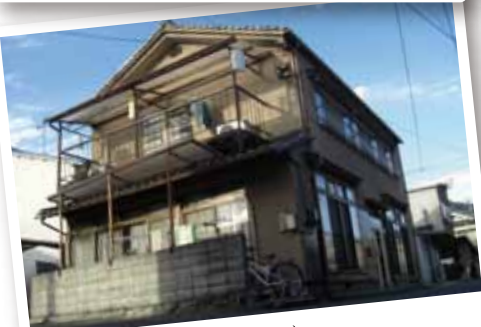
ホームeye(アイ) (自崎町)