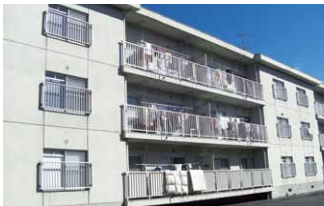
ホームれんげ・ふきのとう・さくら・つくし・なでしこ（広谷町）

TEL (0847) 45-1811 FAX (0847) 45-1812 E-mail: lifesupportkawabe@ohigakuen.com