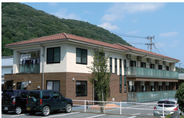
ホームせせらぎ・菜の花・さぶろう・だんだん・芦辺・すみれ・悠和

住所／広島県府中市篠根町61番地 TEL(0847)41-6718 FAX(0847)41-6728